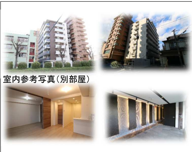
室内参考写真(別部屋)

現在の契約内容 家賃:98,000円 管理費:12,000円 敷金:98,000円 期間:R2年3月から2年間 ※サブリース契約中 家賃:110,000円 期間:R1年6月から3年間 引継ぎ可否:確認中 その他:確認中